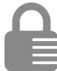
COMBI01 Sans clé Serrure à combinaison