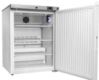
CMS125 Moyen solide Réfrigérateur à porte